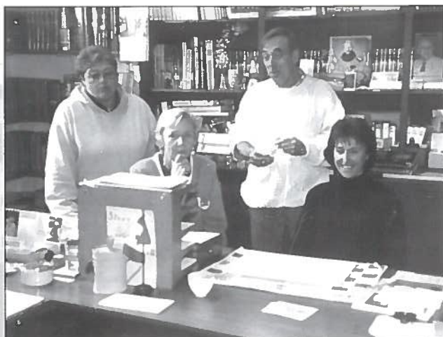
Enkele medewerkers van de boekerij in 1996: