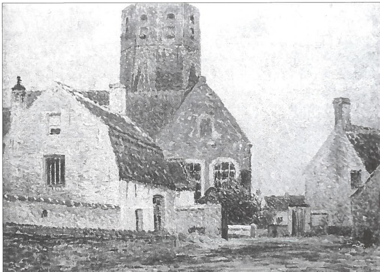
Het kerkgebouw met toren zonder spits, olieverf op doek, 35 x 47 cm.

De kerk van 'Waescapelle' werd reeds in 1271 vermeld. In 1405 werd de toren in brand gestoken door de Engelsen. De toren deed dienst als baken voor de scheepvaart in het Zwin. De gotische kerk werd heropgebouwd tussen 1409 en 1412. Gedurende de godsdiensttroebelen moest een gedeeltelijke heropbouw gebeuren. Op 5 november 1675 sloeg de bliksem in op de torenspits en brandde af. Pas bij uitbreidings- en restauratiewerken in 1907-08 werd een nieuwe spits aangebracht. M.a.w. de kerk van Westkapelle stond er 233 jaar bij zonder torenspits.