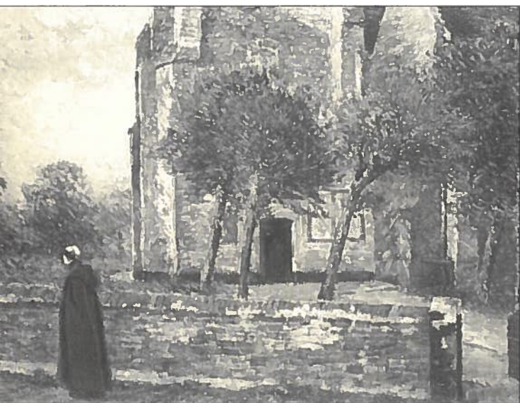
De laatste zonnestralen, (Kerk van Knocke) olieverf op doek 46 x 61 cm.