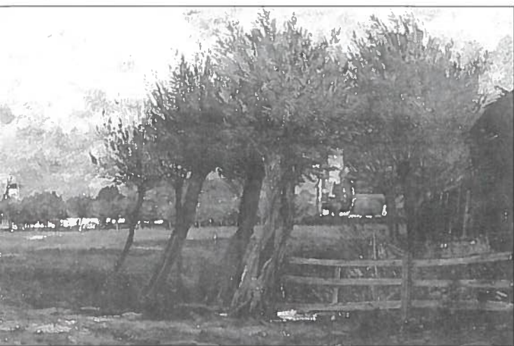
Weide bij Knocke-Dorp.