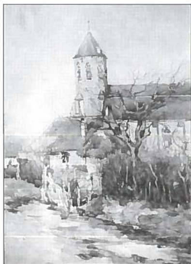
Kerkje van Knocke, aquarel 34 x 24 cm.

Een derde schilderij van Wytsman hangt in de hall van het stadhuis op de eerste verdieping en is reeds meer dan 80 jaar eigendom van het gemeentebestuur.