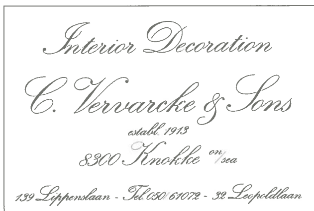
Publiciteitskaartje van de zaak.