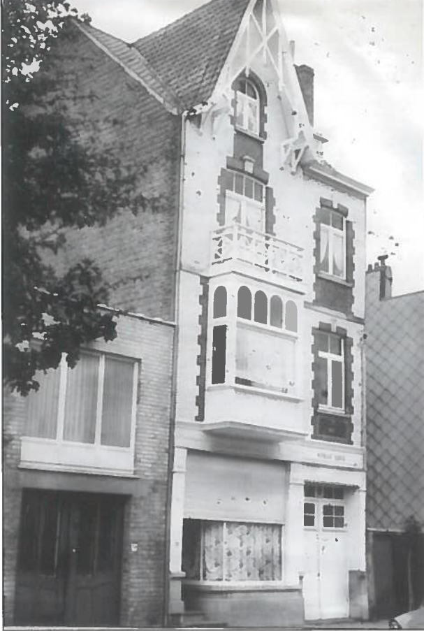
De woning in de Leopoldlaan voor en na de verbouwwerken

(carderen in het Knoks) en ze opnieuw herstellen.