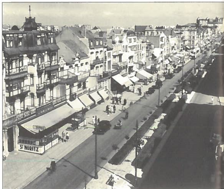
Zicht op de gevels van de Lippenslaan met het 'Hotel St. Moritz' en verder ameublement Vervarcke.