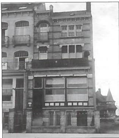
De woning gefotografeerd in 1920 met in de achtergrond de villa 'Siegfried' uit 1902 in de Leopoldlaan.