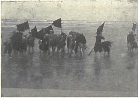
OP HET STRAND.

KNOCKE AAN ZEE. SCHOOLKOLONIËN DER LIBERALE STUDENTEN AAN DE GENTSCHЕ HOOGESCHOOL.