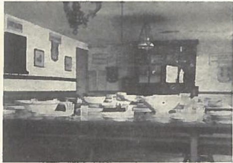
DE GROOTE EETZAAL (PLATVLOERS).

KNOCKE AAN ZEE. SCHOOLKOLONIËN DER LIBERALE STUDENTEN AAN DE GENTSCHЕ HOOGESCHOOL.