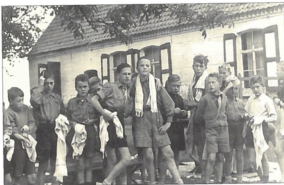
1952. Zomerkamp in Ruiselede. Na de katewas 's morgens.

In juli trokken we elk jaar op kamp voor 8 à 10 dagen. Daar was wel enige voorbereiding voorafgaand nodig alvorens het kookgerief, de tenten, de slaapzakken en het proviand en onze rugzakken op een grote vrachtwagen van de Melkhandel Gabriëls uit de Nestor De Tiërestraat geladen werden. Onze camping bestemmingen lagen niet in de Ardennen of Noord Frankrijk, maar waren amper boven Brugge gelegen: Ruddervoorde, Jabbeke en Ruiselede. Meestal kwamen we terecht op een boerderij. De tenten, kookplaats en eethoek kwamen op een weide te staan. We sliepen altijd in een schuur, waar we een slaapmatras (een grote jutezak) vulden met stro. Opblaasbare luchtmatrassen bestonden toen nog niet!