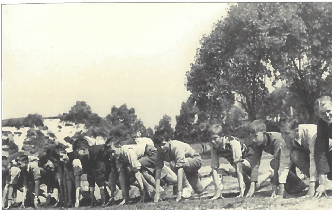
1952. Professionele start van een loopkoers op het oude voetbalplein.