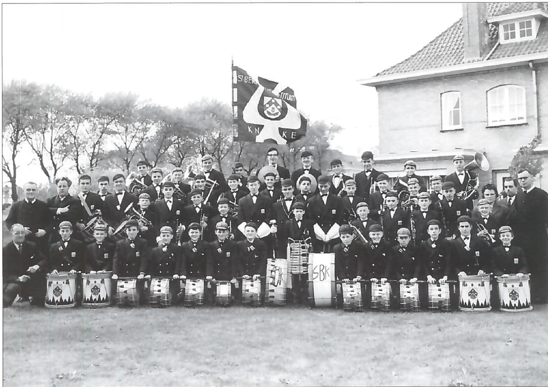
1961. Het gemoderniseerde korps voor het woonverblijf van de Frères aan de Sportlaan.