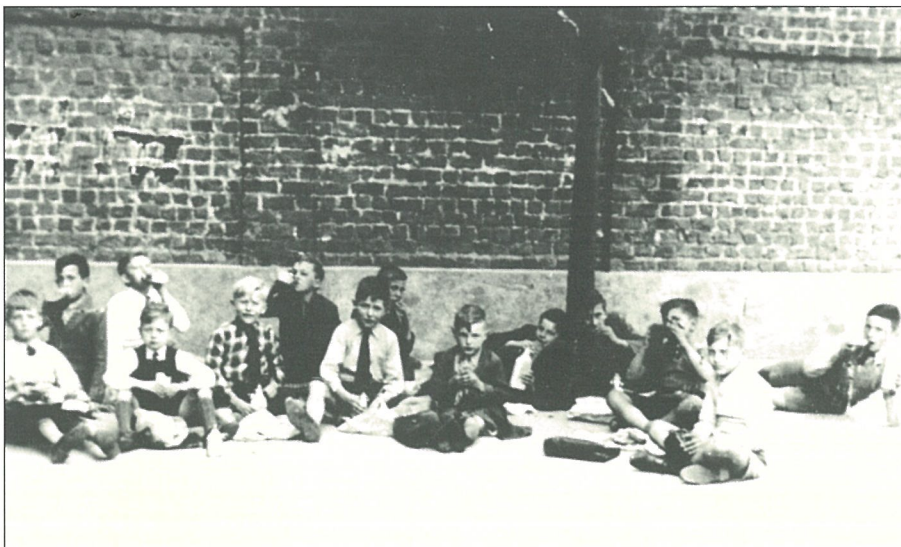
Zomer 1945. Kinderen die buiten de dorpskern woonden aten hun "lunch" op de speelplaats.

Na 1945 zaten de klassen in de Smedenstraat proppensvol. Klassen van 40 en meer leerlingen waren geen uitzondering. Het gezag van de leraars was vanzelfsprekend. Vooral middels de wekelijkse puntenkaart werd een deugddoende discipline gehandhaafd. Op deze wekelijkse puntenkaart werden 10 punten toegekend voor respectievelijk Gedrag & Wellevendheid, Vlijt, en Orde en Stiptheid. Elke zaterdagmiddag kwam Broeder Directeur in elke klas de puntenkaarten aflezen. Wie slechts 27 of minder punten behaald had op 30 was er aan voor de moeite. Er volgde een donderpreek van Broeder Directeur en de volgende woensdag moest men de ganse namiddag straf komen schrijven.