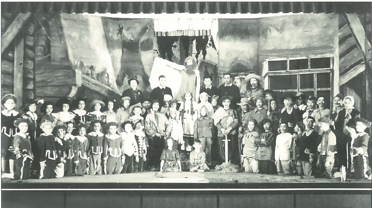
Herinneringsfoto van 'De Gelaarsde Kat'.