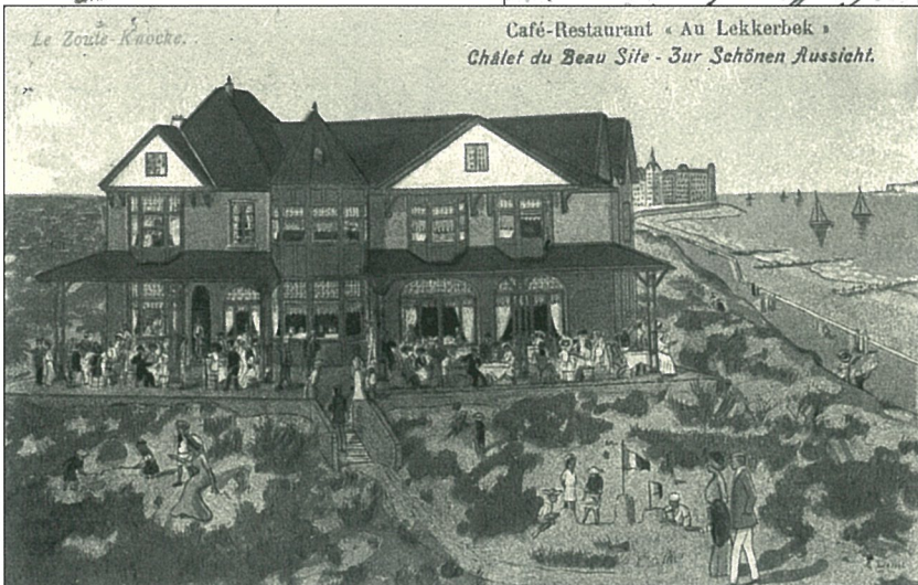
Café-Restaurant « Au Lekkerebok » Châlet du Beau Site - Zur Schönen Aussicht.