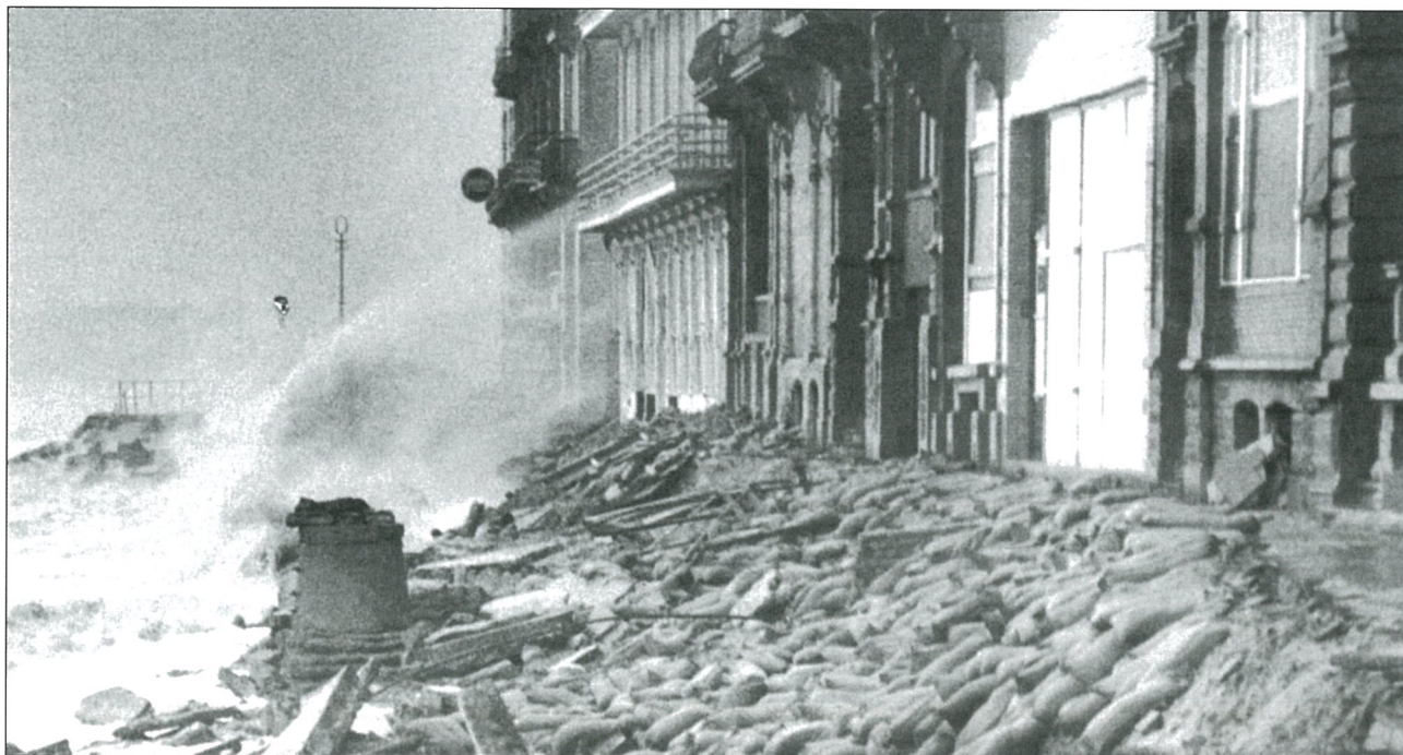
De wandeldijk in Heist is compleet weggespoeld. Het leger heeft zandzakjes tegen de gevels gegooid.