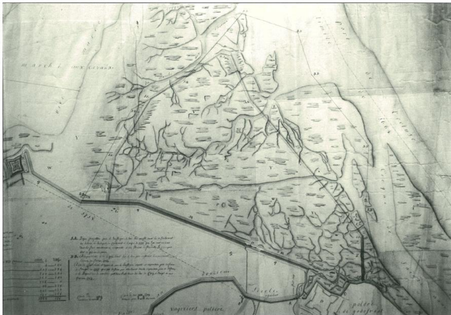
Kaart uit 1784 van Houshe, landmeter van het Brugse Vrije met de aanduiding van de greets van 1661. Op de Paulusdijk de schuapssille (hoeve De Grote Stille).