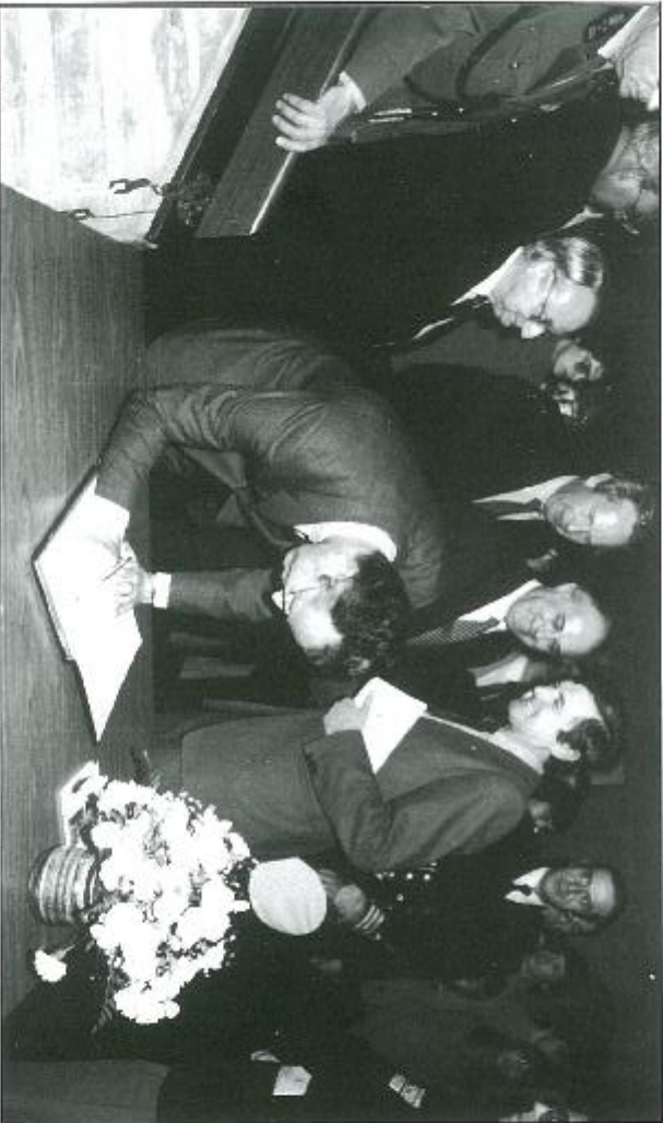
Besök Koning Boudewijn