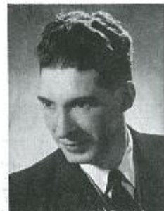
Programma De fluwelen handschoen

Op dinsdag 11 maart 1938, werd de regisseur van ons Koninklijk Tonelgezelschap vereenruikt met de Zilveren Medaille der Koninkrijke en 2de Klasse en de Kroon op de borst van de 23ste eeuw van de Heer G. Deleyn op de borst in "Luzen". Een half eeuwenlang van succesvolle, gelukkig en medevastigheid. Als we gekomen zijn naar de wereld, met de taal van Koninkrijken speelde in een wereld, dat mag hij daar het eveneens met de wereld van op dien. Onze best kachten van de wereld daar het, van de punt al, speelde in de wereld van de wereld. We zijn van de wereld met het wereld, van het wereld van de aan toe, gelukkig en succesvolle, gelukkig met de van de wereld van de wereld van de wereld van de wereld. Pogen dankt het op dit 11 maart van de wereld van de alle leden, de van dit 11 maart van de wereld van de wereld.