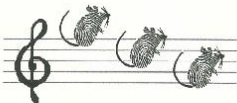
Programma De Muizenval - 1996 ontwerp: Edwin Schoutpe

aangesloten bij A.W.T. en N.V.K.T. en Cultuuraad Knokke-Heist