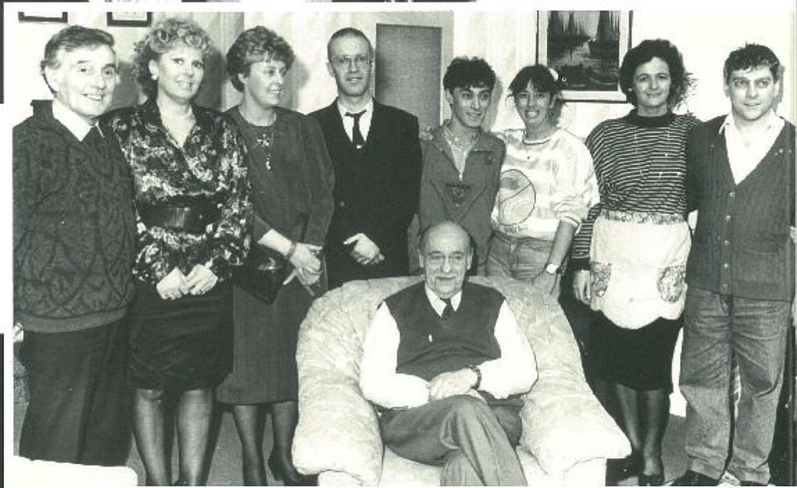
Wat doen we met bonpa? 1989