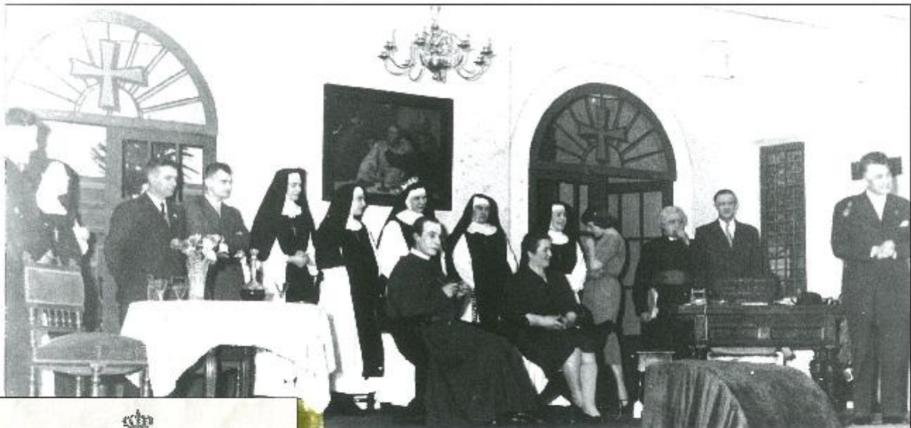
De fluwelen handschoen - 1938