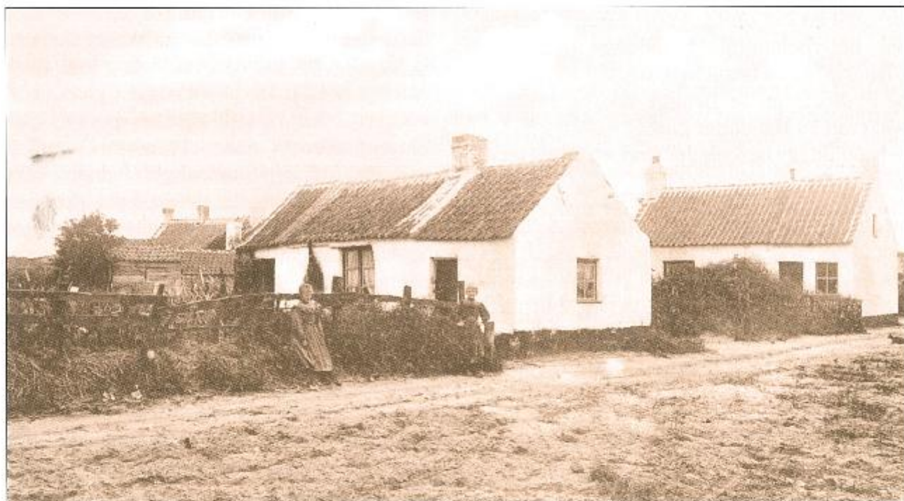
Huisjes van het Oud Zoute.

Onder landbouwgebied levert het weinig belang op; want het bestaat meest uit dorre duinzand, met valleien en zandheuvelds en alleenlijk treft men hier en daar een schamel doch krakend net huizeken aan met een streepje land zoo groot als een laken. Het Zoute levert onder een ander oogpunt meer