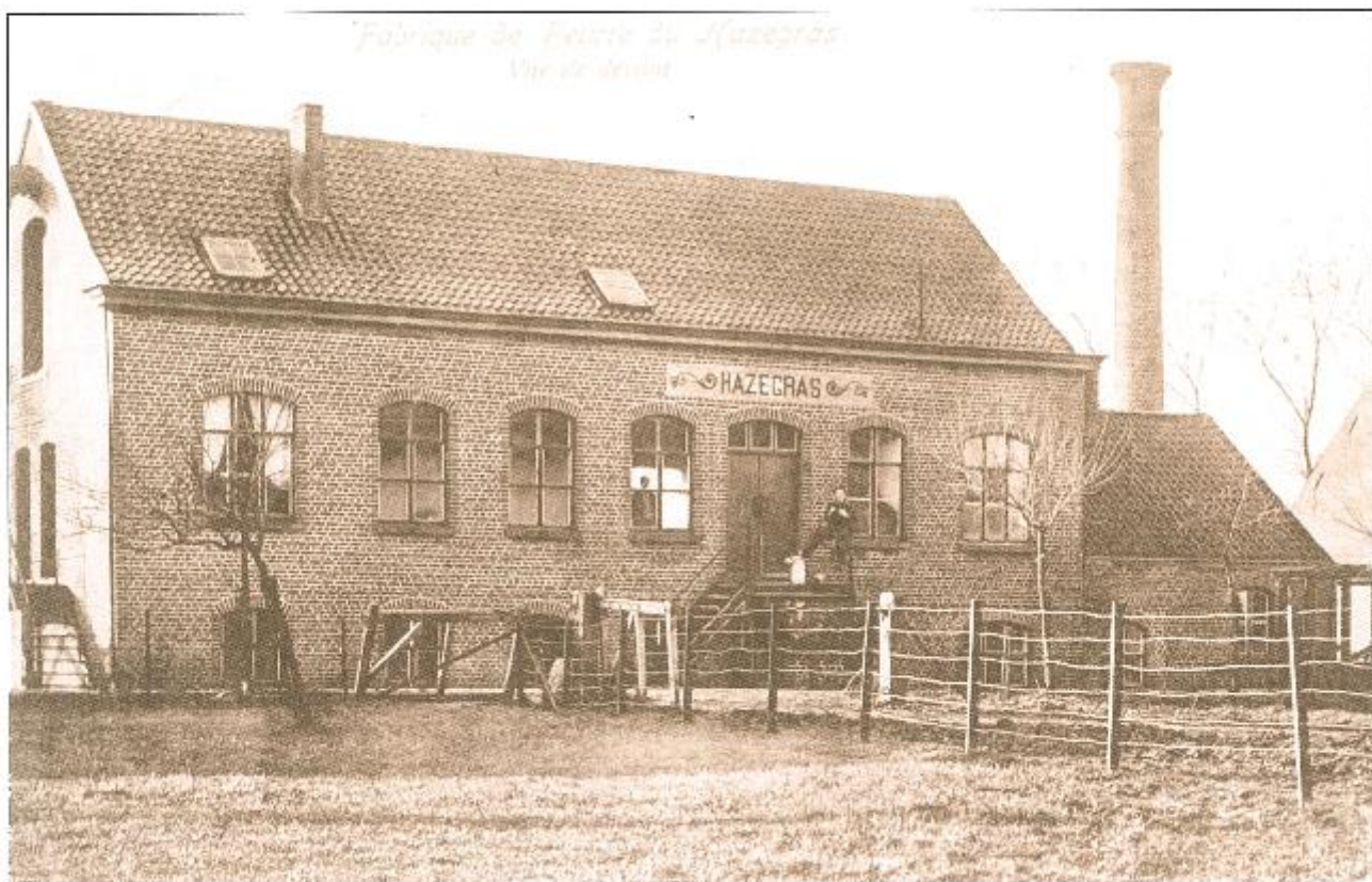
De kaas- en boterfabriek van het Hazegras bleef in werking tot 1904.