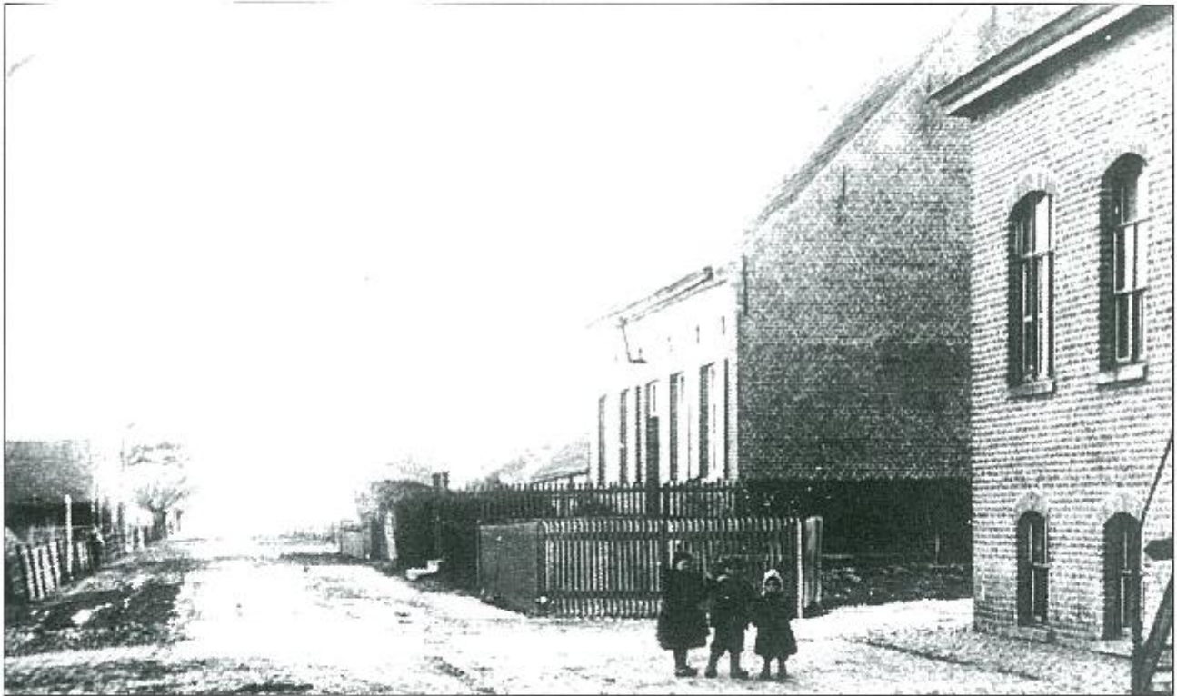
Hoeve op het Hazegras.

belang. Kundige vakmannen hebben met nauwgezette kennis gebruik weten te maken van zijne breede, naakte duinen en zijne cigenaardige ligging; wegen zijn getrokken en aangename zomerverblijfplaatsen rijzen als uit het zand. Geenzins ware het vermetel te zeggen dat het Zoute een der geliefkoosde zomcroorden, der kust zal worden.