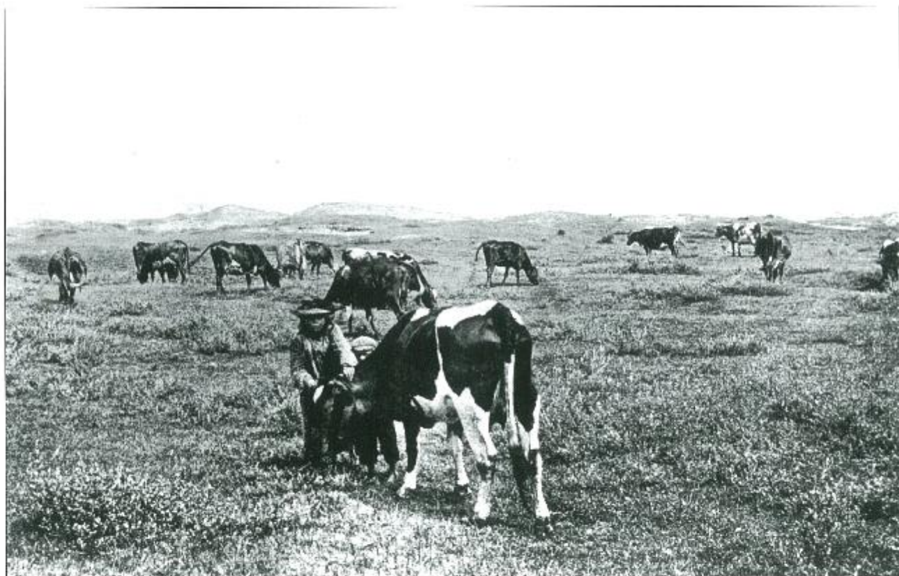
Koeien in de Koekse duivellakte rond de veuwisseling.