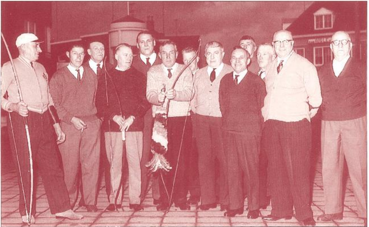
De Noordschutters Knokke - 1964-1965