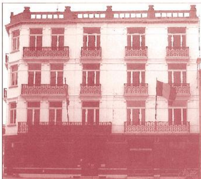
Hotel du Lion d'Or