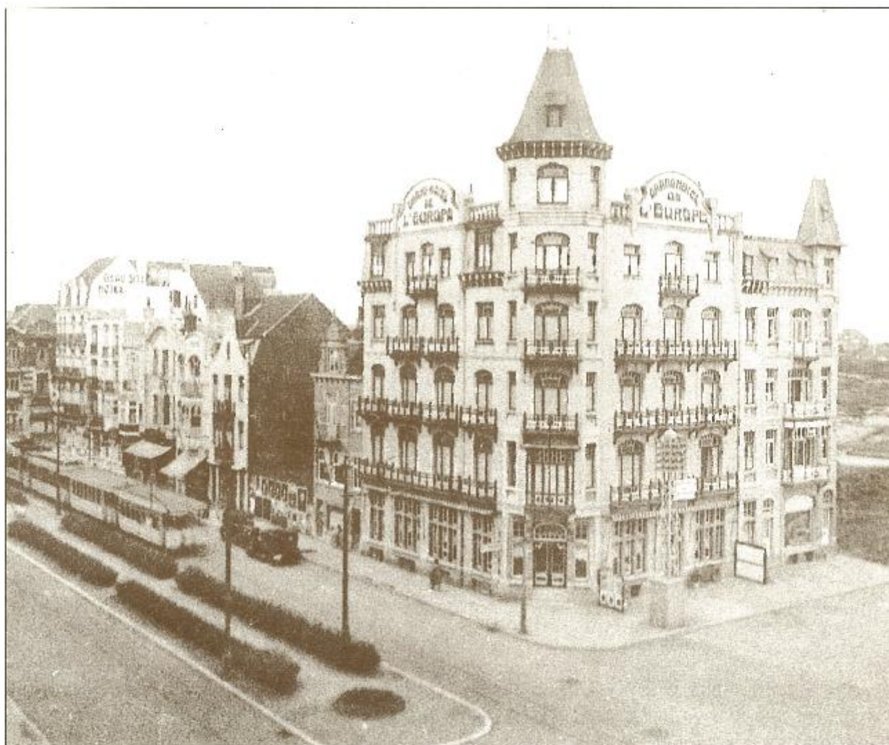
Grand Hôtel de L'Europe