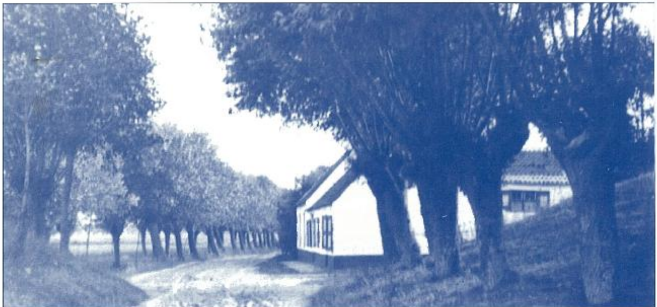
Het oud gemeentehuis van Knokke, op de wijk 't Kalf tegenover de Vaucelles.