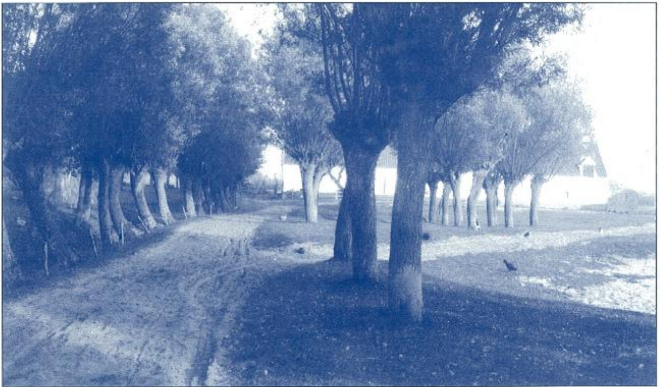
Zeldzame opname uit 1902 van het woonhuis van de hoeve.