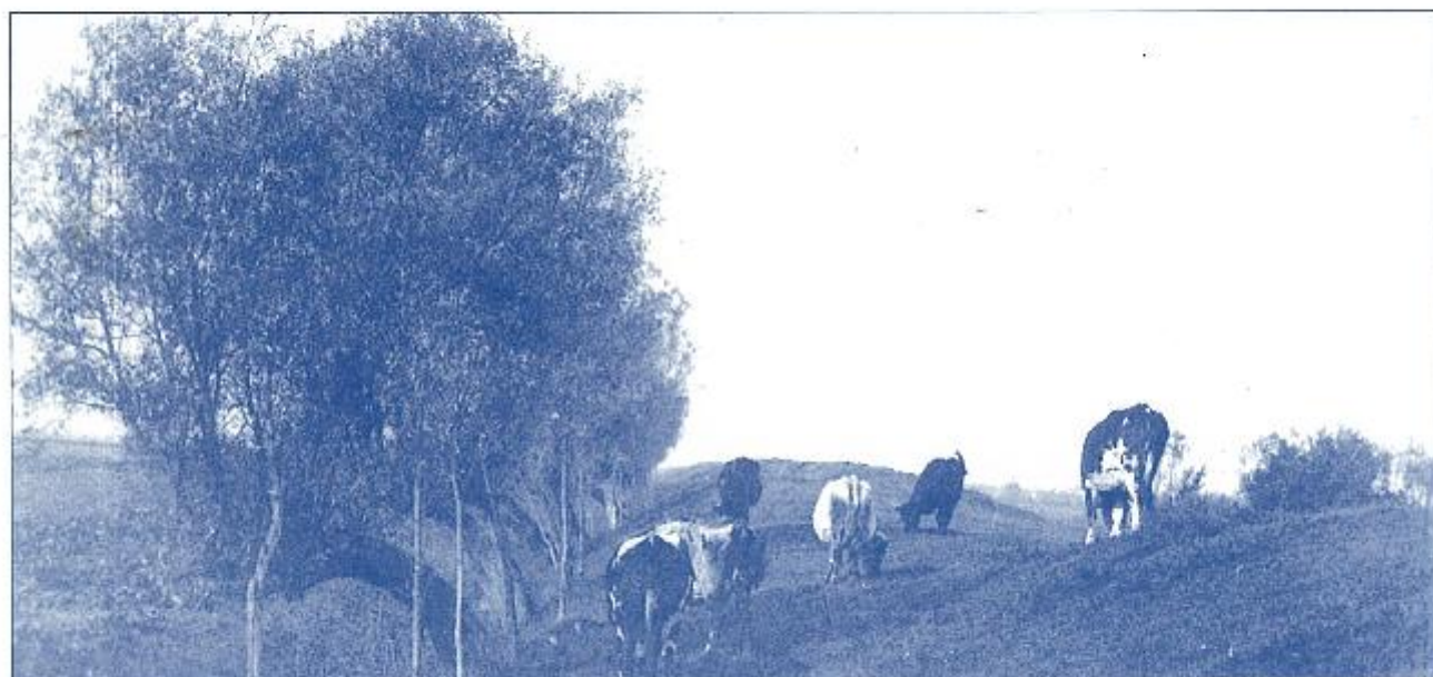
De Graaf Jansdijk in 1889 met grazende koeien