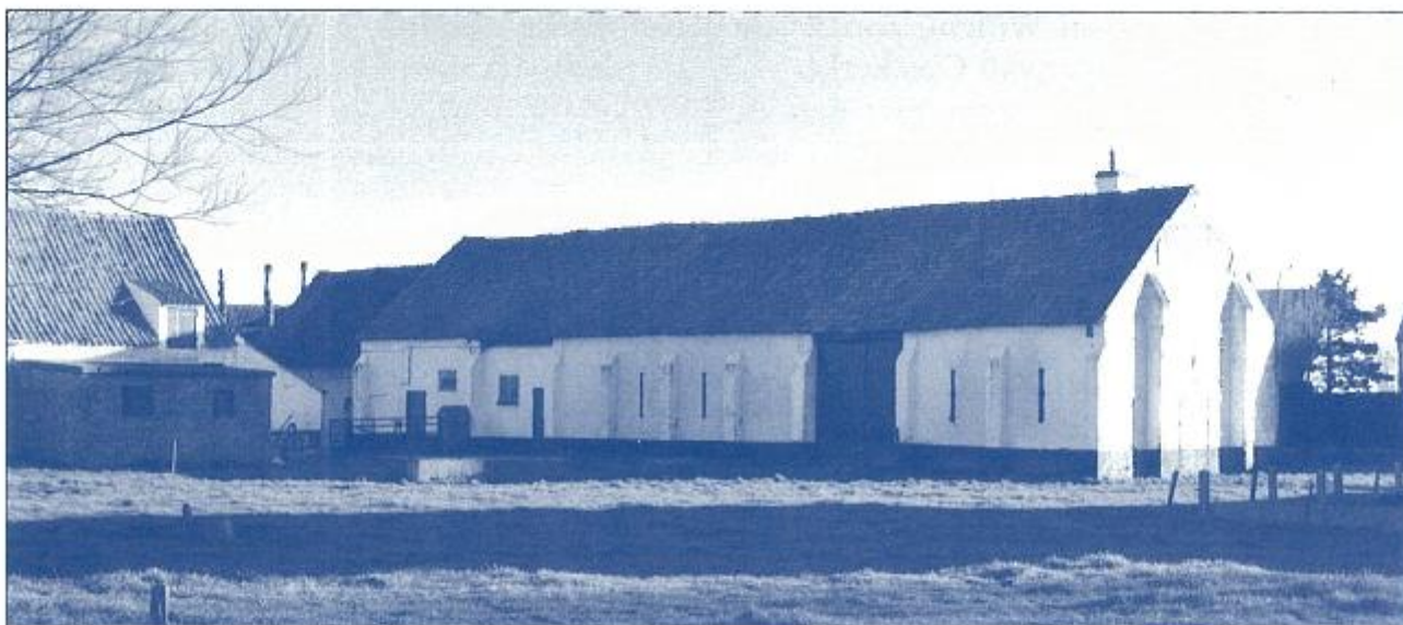
De schuur met zijn steunberen gefotografeerd in april 2002.

periode 1322-1330. Door schuldeisers uit Valenciennes achtervolgd, ziet de abdij van Vaucelles zich in die periode verplicht haar schuur in Knokke over te dragen aan de abten van Ter Duinen, van Loos, van Cambron en van Clairmarais. Alhoewel Vaucelles enkele jaren voordien alle schulden tegenover Ter Duinen en de andere cisterciënzerkloosters moet voldaan hebben en aldus de volle controle over zijn eigendommen in Vlaanderen had herwonnen, stond Vaucelles in 1395 een erfpacht van 50 jaar en met ingang in 1400 al zijn gronden in Vlaanderen af aan de Duinenabdij. In 1450 werd die pacht met vijftig jaar verlengd. Er zijn geen documenten beschikbaar (4) die er op wijzen dat de monniken van Ter Duinen na 1500 nog pachters van de Keuvel geweest zijn. Het is in alle geval zo dat in de ommeloper van Volkaartsgote uit 1559, de monniken van Vaucelles opgetekend staan als eigenaars van alle percelen, die hun voorgangers in 1255 hadden gekocht.