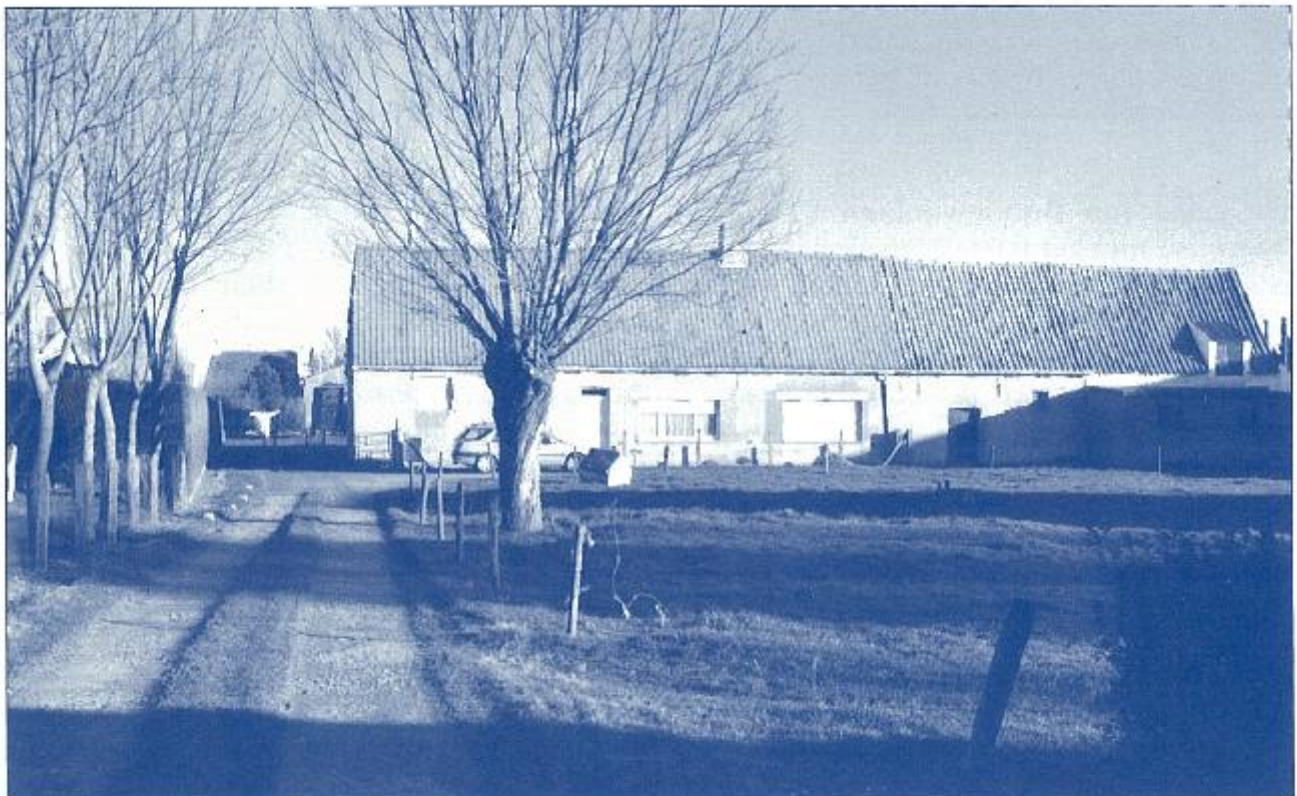
Dezelfde locatie in april 2002