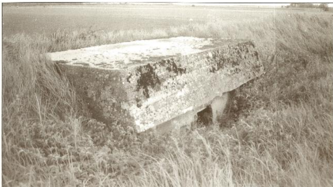
Foto 9 - Type NHP-2 in steunpunt Wilhelm.