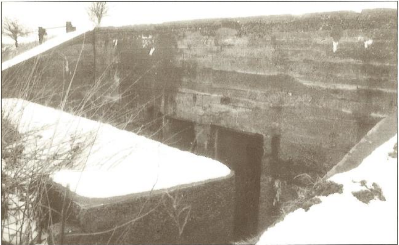
Foto 5 Type FSD-2 in steunpunt Dora.