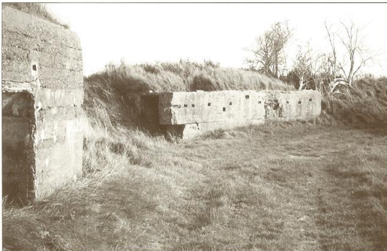
Foto 10 - Type NHP-1 in steunpunt Wilhelm.