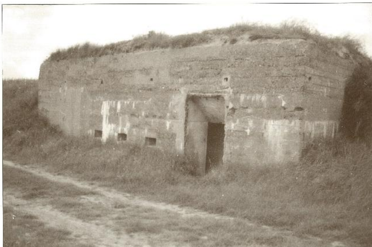
Foto 8 - Type NHP-1 in steunpunt Wilhelm.