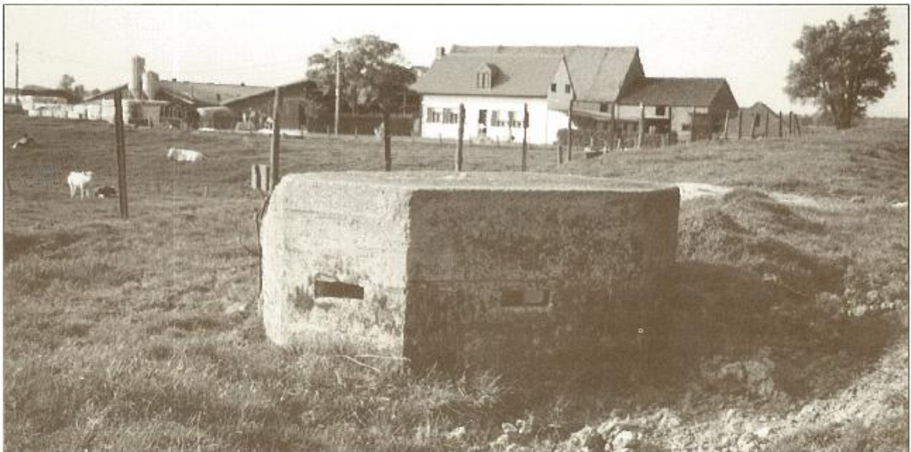
Foto 7 - Type HGF-2 in steunpunt Heinrich.