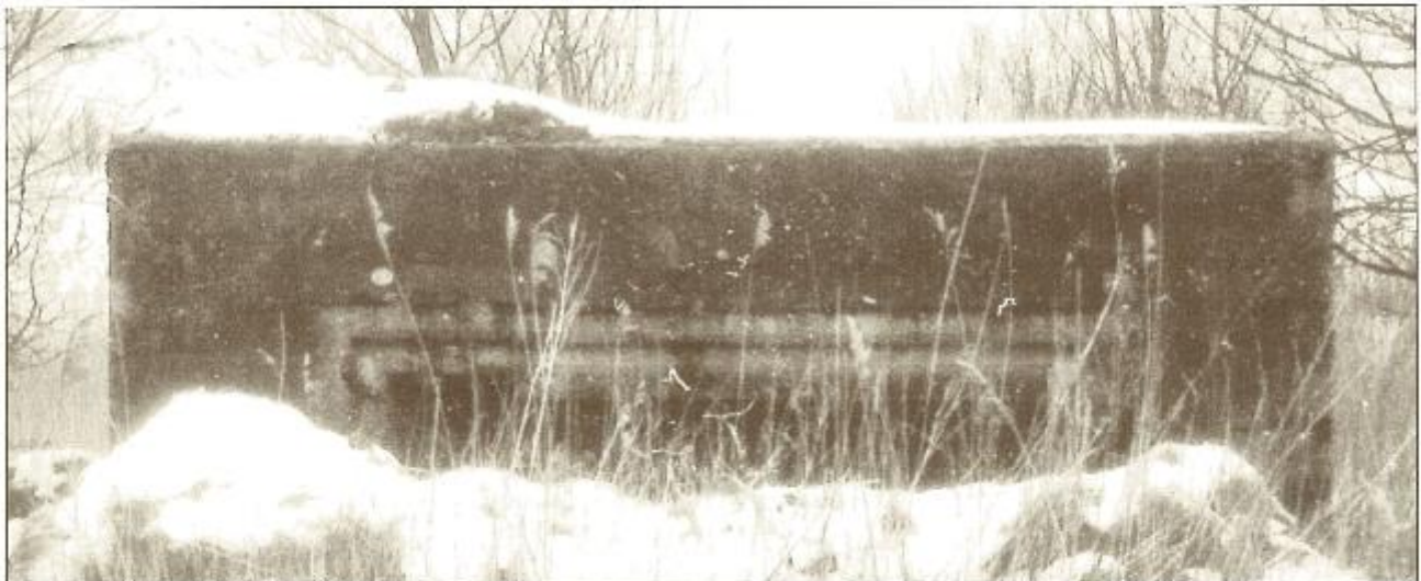
Foto 6 - Type FSD-3 in steunpunt Dora.