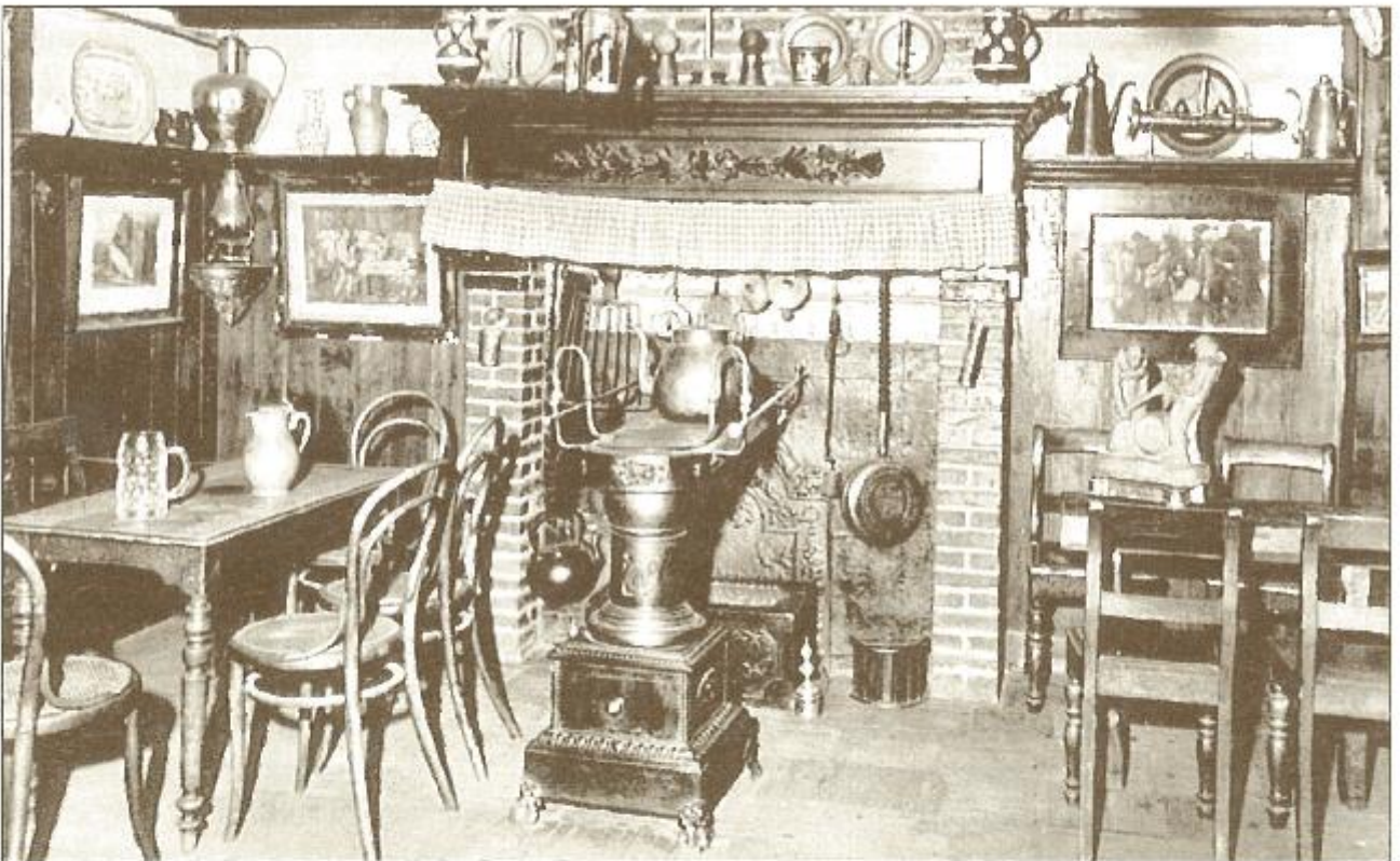
Het sternmige interieur.