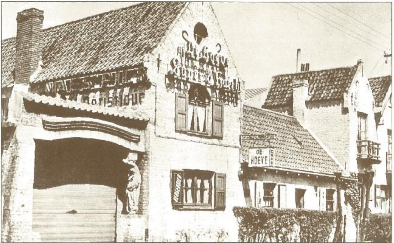
De HEEVE in de jaren '50.