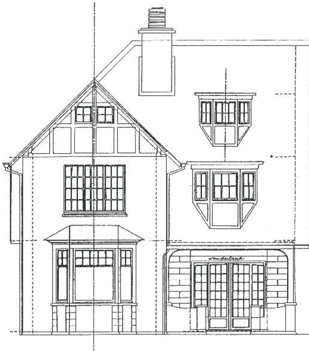
Plan van de voorgevel (Architect A. Pirenne, 1912).