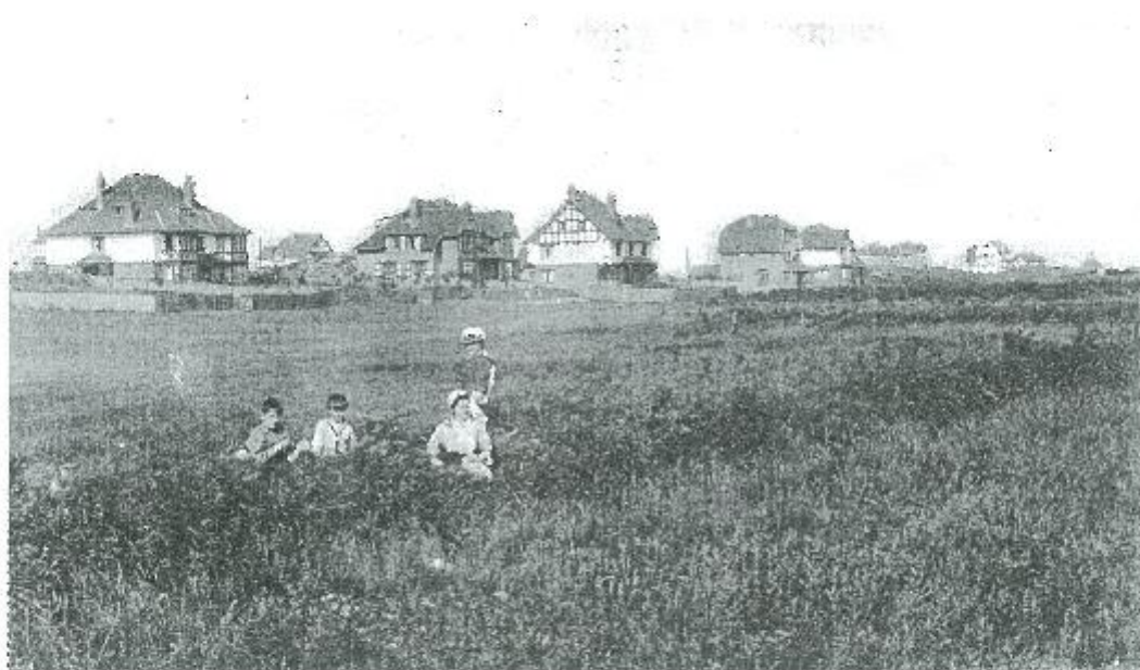
De cottages gezien vanaf de Elisabetlaan; v.l.n.r. Cottage Les Ifs (1909), Jean de Nivelles (1910), Colac (1910), Terpsichore (1912), Wonderland . Op de achtergrond de latere Sparrendreef.

Naar aanleiding van het artikel ARCHITECT ADOLPHE PIRENNE in het tijdschrift Nr 35 van Cnoc is ier (Jaargang 1998) kwam er enige reactie van de eigenaar van een villa in de Fochlaan. We kregen een overzicht van de bewoners en vonden het nuttig deze gegevens te publiceren.