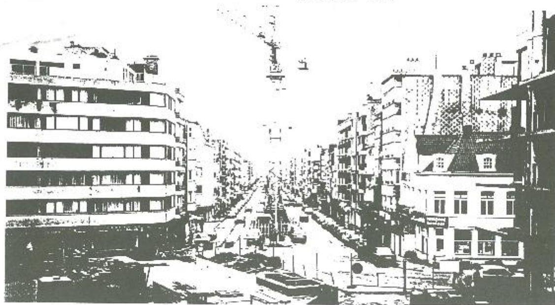
Geen jaar zonder bouwcransen in de laan, hier voor Van Bunneplein en Grand Hotel