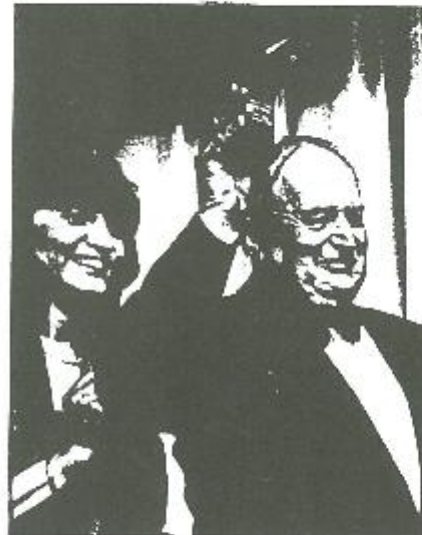
De Prijs van Verdienste der Persclub Casino-Knokke