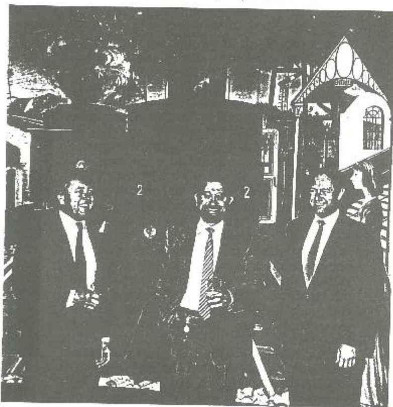
Minister Herman De Croo bezocht het Delvaux-stationnetje in de casino-hal, of het schilderij uit Chaufontaine hierheen gekomen.

De Zoute Compagnie plande een tweede golf van vliegveld tot Zwinbosjes. De