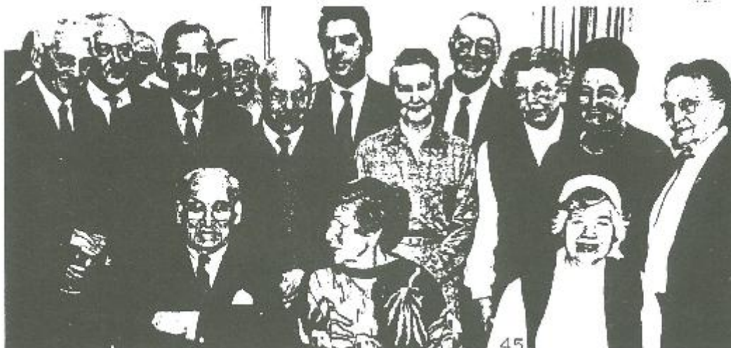
OLV ter Linden 40 jaar