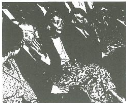
Prinses Paola in Scharpcord, op dag 30 jaar instituut voor gehandicapten