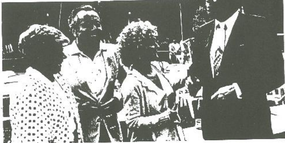
Ontmoeting in Zwinpark,