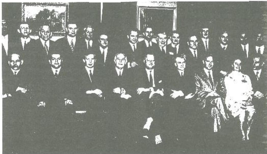
Het eerste gemeentebestuur van de fusiegemeente op 19 maart 1971 na de historische zitting.