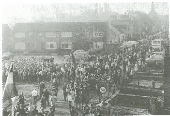
Vanuit Hoofdplaat naar Knokke : 33 km