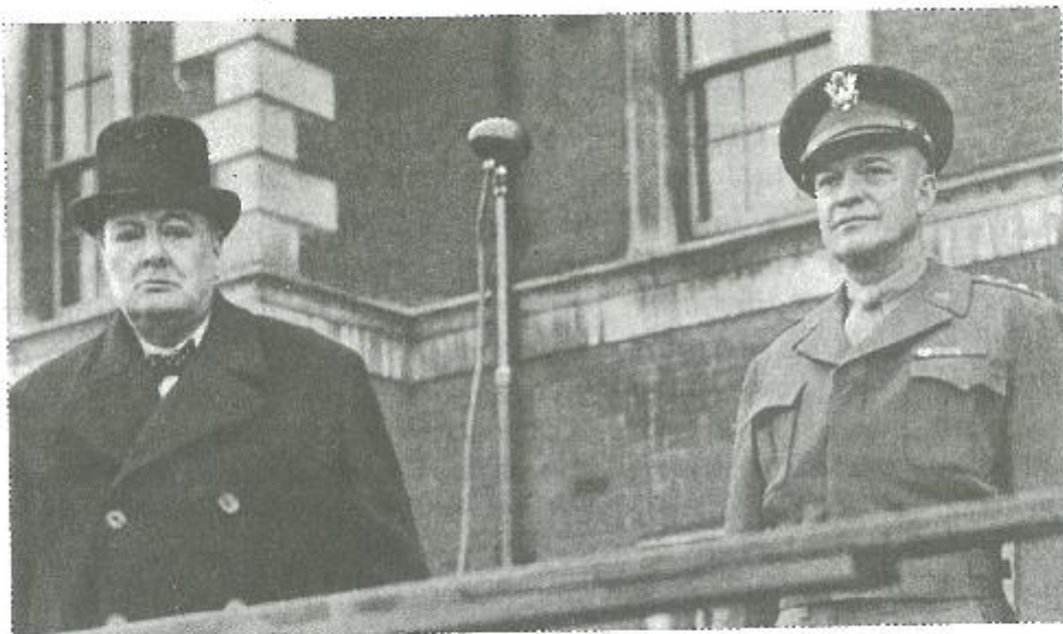
Winston Churchill (1874-1965) Brits staatsman en letterkundige, was op 10 mei 1940 eerste minister van Groot-Brittannië, trad in 1955 bij hoge leeftijd af.