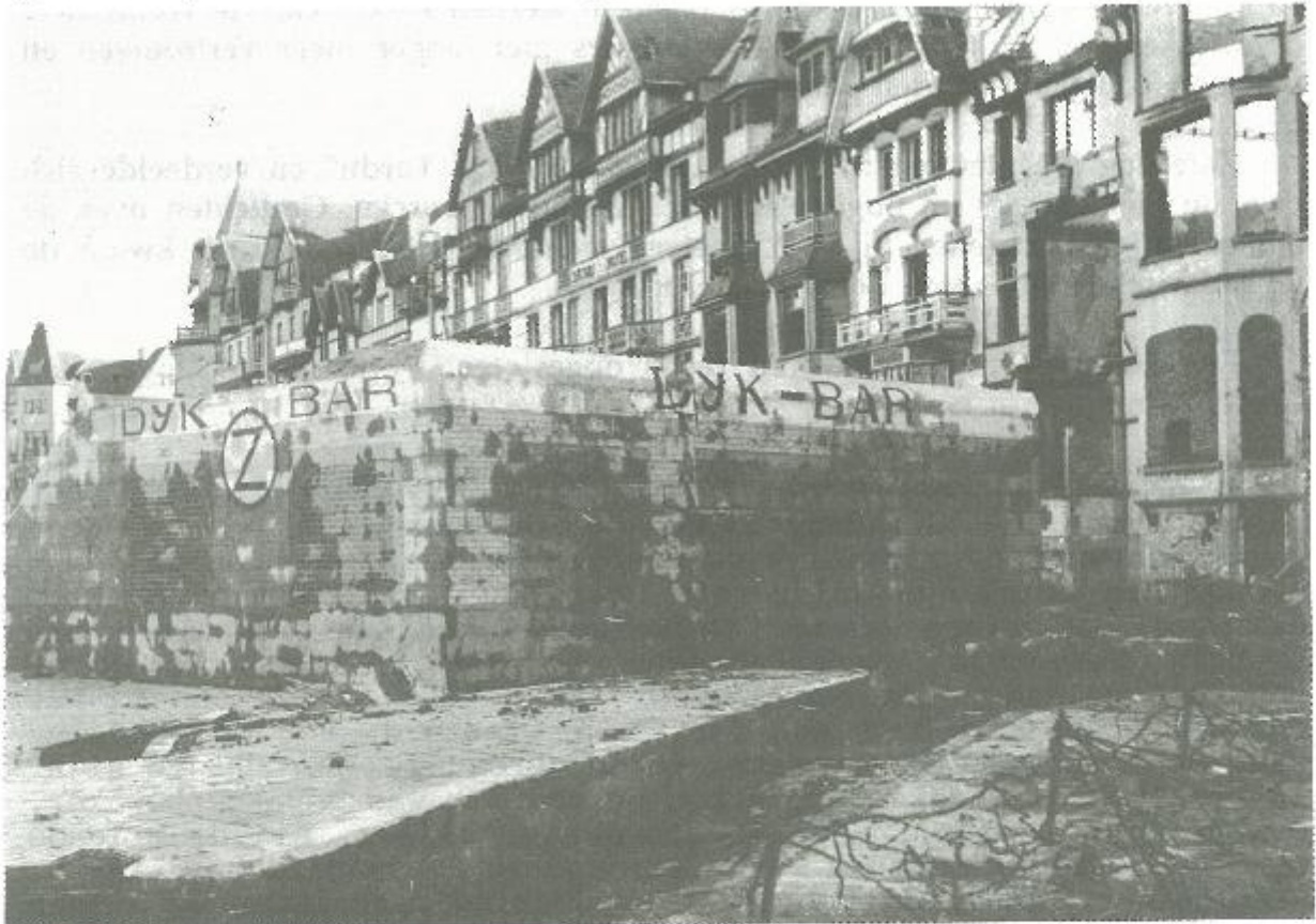
Ten ongewone Dijk Bar in het Zoute