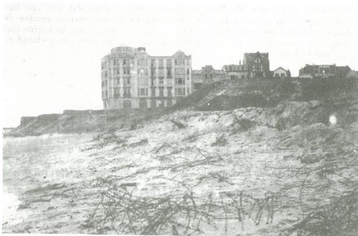
De oostelijke bocht van het Albertstrand bij het Rubens Hotel was een strategisch punt in de Atlantiekwal : uitkijken over de baai tot Heist en Zeebrugge.