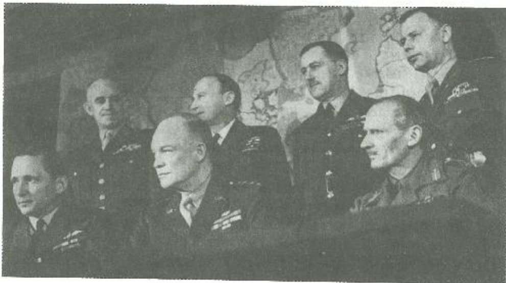
Staf der Geallieerden. Vooraan luchtmaarschalk Tedder, opperbevelhebber Eisenhower, legermaarschalk Montgomery. Achteraan gen. Bradley, adm. Ramsay, maarsch. Malloy, lt. gen. Smith.

Het is duidelijk dat Churchill voor wat aanvang september 1944 gebeurde, Eisenhower en Montgomery evenzeer aansprakelijk stelt. De onverwachte verovering van Antwerpen door Montgomery is het Opperbevel wellicht boven de pet gestegen. Eisenhower zegt zelf dat het hierdoor als "geëlektriseerd" werd.