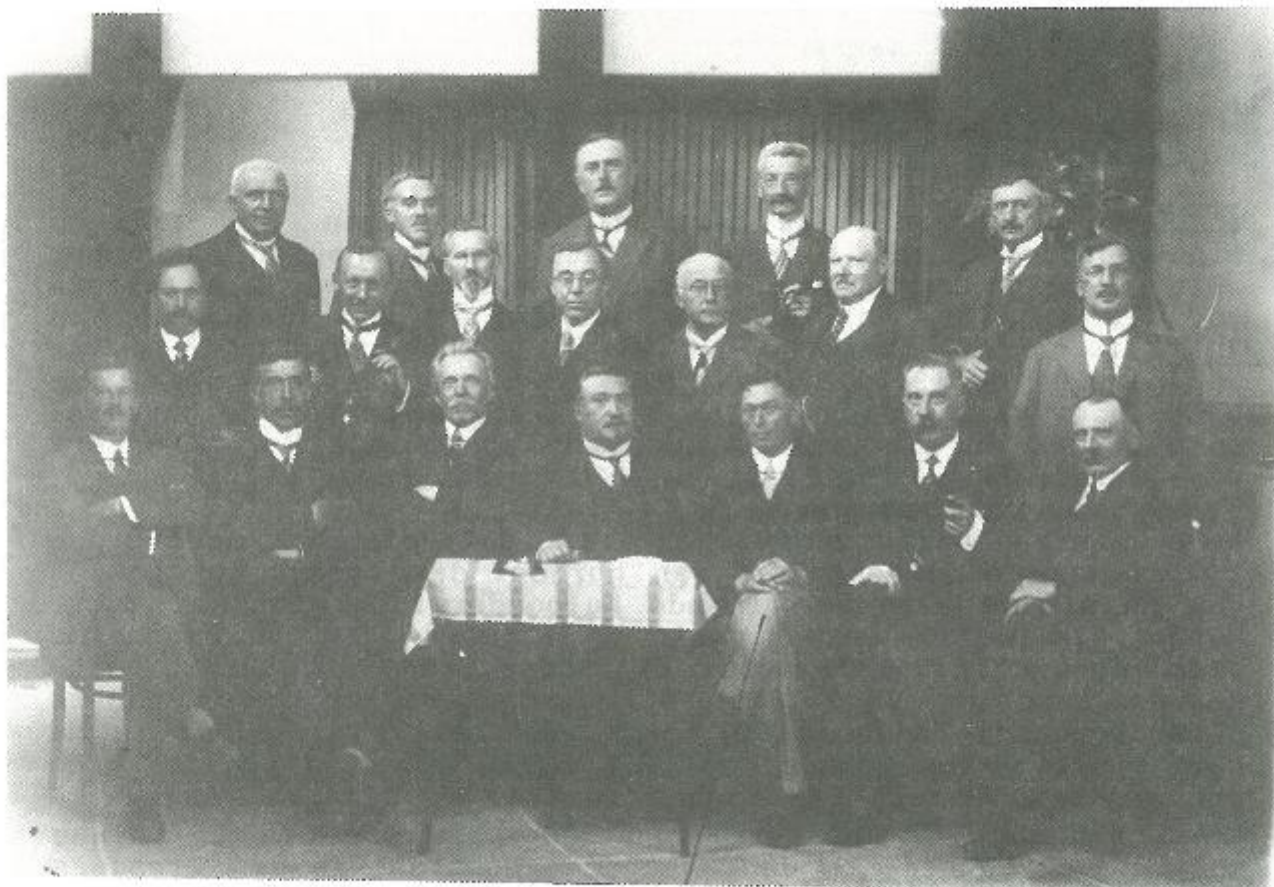
Bijlage III. Klasvergadering van gewezen laatste-jaarsstudenten van de normaalschool van Torhout.