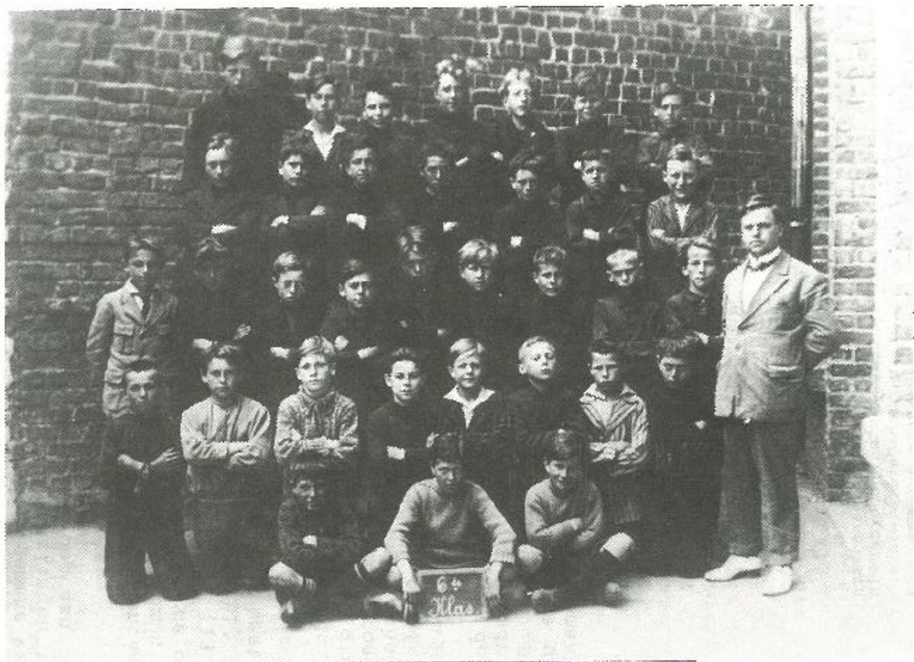
Gemeentelijke jongensschool in Knokke.