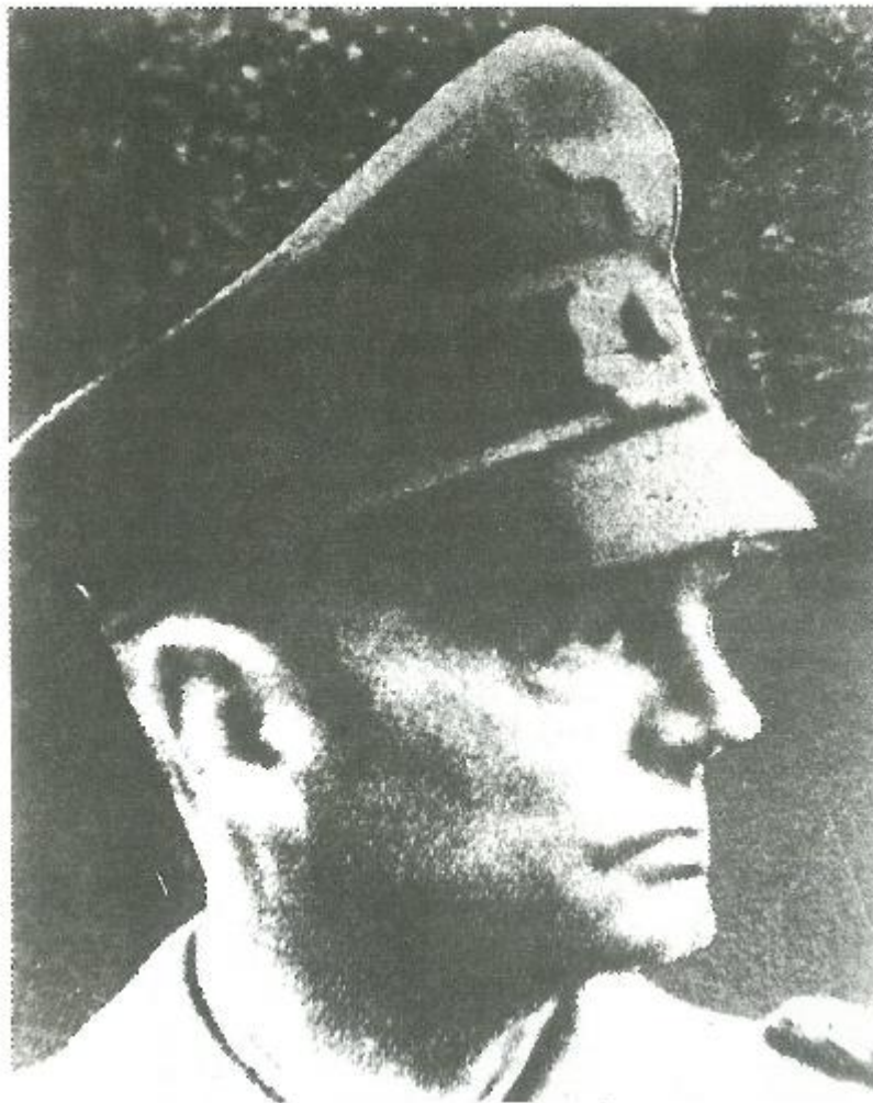
Generaal Eberding, bevelhebber van de 64e Duitse Infanteriedivisie in de Schelde Festung (voor de Canadezen de Scheldt Pocket).