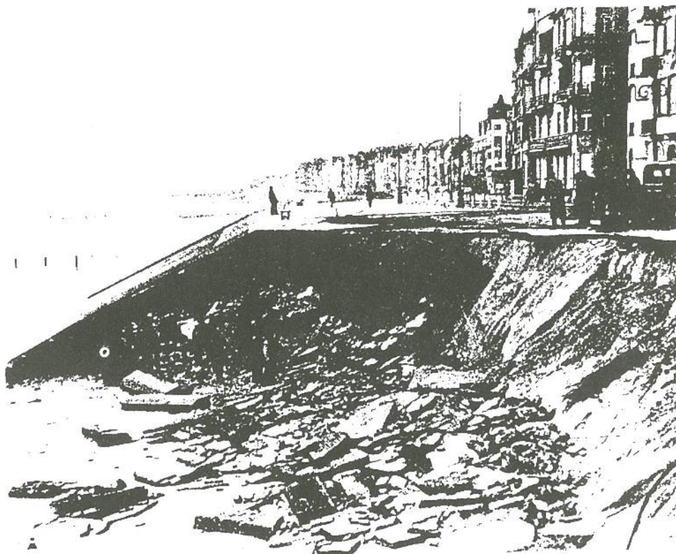
De dijk werd te Knokke naar het Zoute toe grotendeels stukgeslagen en de irrigaties bedreigd. Bij ebbe kwamen legerafdelingen ter plaatse om met zakjes zand de zeewering te versterken.

In de zeedijk werden 13 bressen geslagen, van West naar Oost: de weggespoelde duinen aan het Albertstrand, dan de doorgebroken dijk tegenover Piccadilly, Marie-Joséplein, Hazegras, Babord, Blaton, Lekkerbek, François, Sneed, verderop een viertal, een steun-