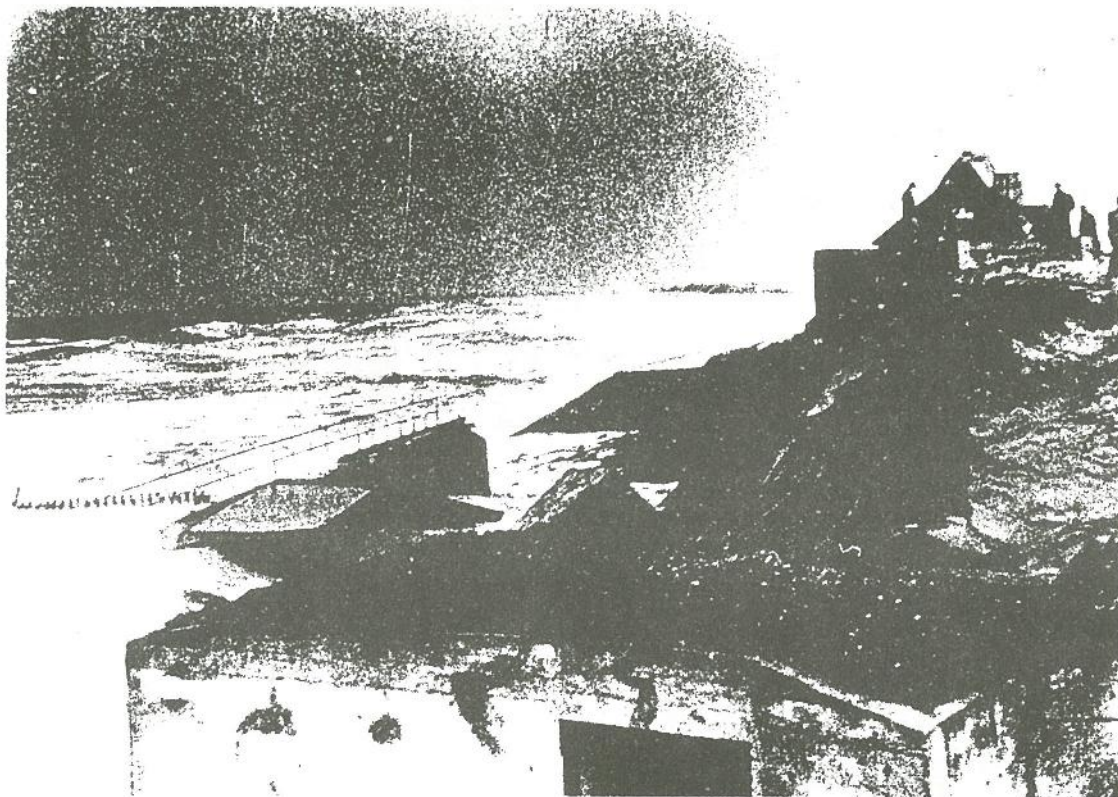
1 febr. 1953 : de stormvloed in volle hevigheid bij de Scheldemonding. Voorbij de Lekkerbek te Knokke is de dijk doorbroken, worden de duinen aangetast en dreigt een villa in te storten.

Met afgeronde cijfers komt men tot de herdenking van bijzondere gebeurtenissen. Zo is het nu jaar geleden dat een ware stormramp de kust bedreigde en de Zwinpolders zonder de beschermende dijken tot vele kilometer landinwaarts door de zee zouden overweldigd geweest zijn. Zo de stenen zeedijk op verschillende plaatsen bezweek — de duinenrij hield echter stand — dan waren het de Internationale Dijk en de Hazegraspolderdijk die met hun aarden wal uiteindelijk het geweld van de zee in toom hielden. Het gebeurde in de nacht van zaterdag 31 jan. op zondag 1 febr. '53.