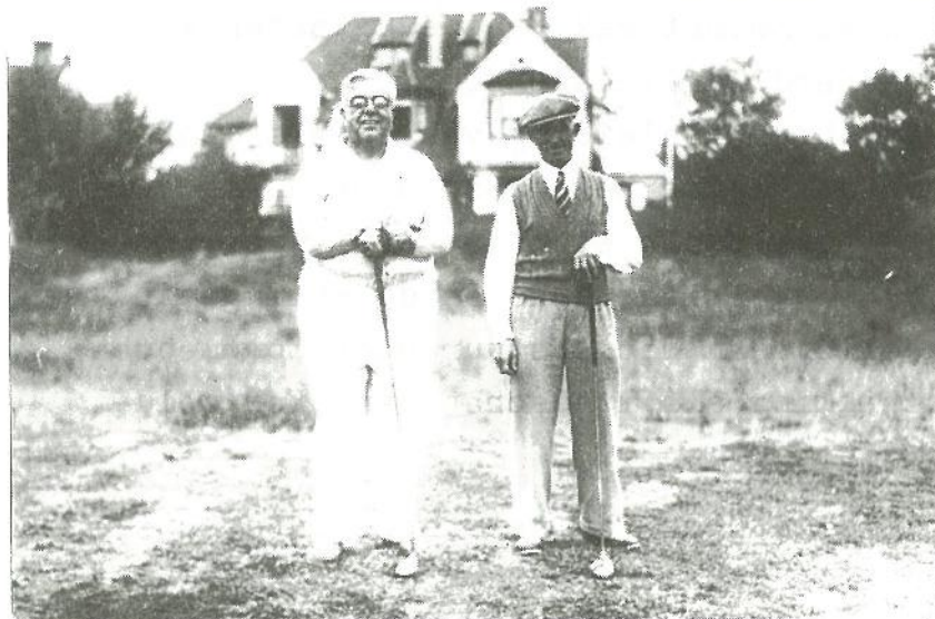
Tussen beide oorlogen waren de voorname gasten van het Zoute ook op de golflinks.- BOVEN: Leopold III voor een wedstrijd op 2 juli 1939.- ONDER: de Aga Khan, "rijkste man ter wereld" en die zijn villa bij de Boslaan had, hield in 1934 eveneens van een partijtje golf.