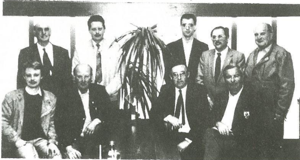
Een veldaan bestuur van Cnoc is Ier met de trofee onder de palmboom