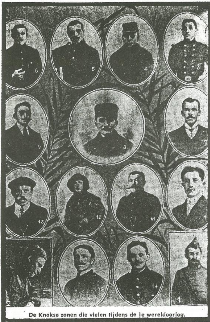
De Knokse zonen die vielen tijdens de 1e wereldoorlog.