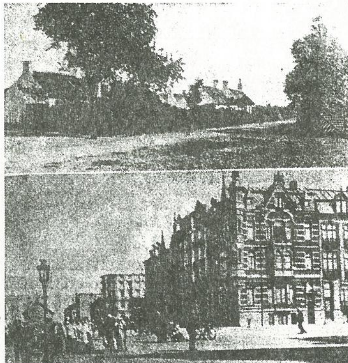
BOVEN: bij het afsluiten van de vorige eeuw had het dorp nog al zijn landelijke charme aan te bieden. Hier ziet men de «dikke boom» bij «Mon Rêve», een der eerste villa's aan de Jodestraat. ONDER: de zeedijk verlicht door gaslantaarns.

Van Heist tot Knocke vormen de duinen niet enkel een kuststrook. Zoals in de omgeving van Blankenberghe behielden ze hun grootsheid van weleens, de wilde en geheimzinnige charme van hun diepe en sombere poëzie. Het geruis van de zee aan de rand, de plechtige stilte die midden de verlaten heuvels heerst, alle ontbreken van bomen, daarbij een volstrekte verlatenheid, alles is in deze eentonige woestijn samengebracht om de wandelaar over te laten aan zijn droomgedachten en hem te doen houden van de poëzie der duinen».