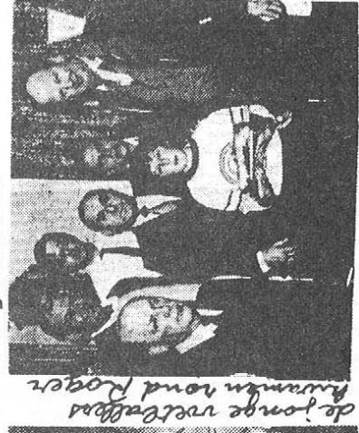
de jonge verdrass huizen vond Roger