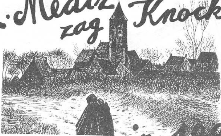
het dorp met de vrouwen in Rapsmuntel op weg naar de kerk