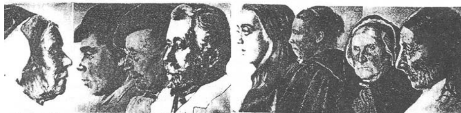
alle tekeningen van K. Mediz bevinden zich in het Kunstpatrimonium Kn.