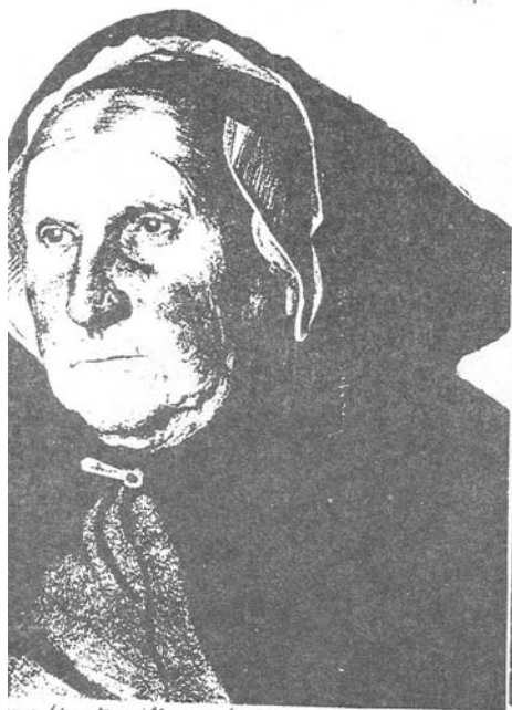
in Monteville uit 't Zoute met Egypische Raps en mantel