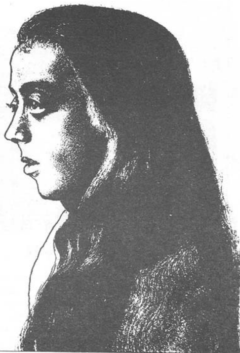
Knokke met langgestreken haren