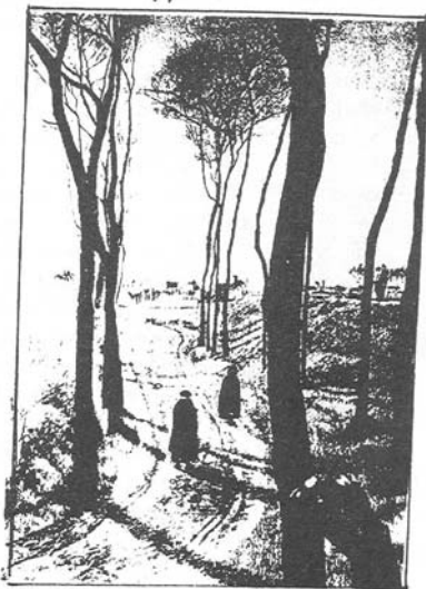
tussen duin en polder