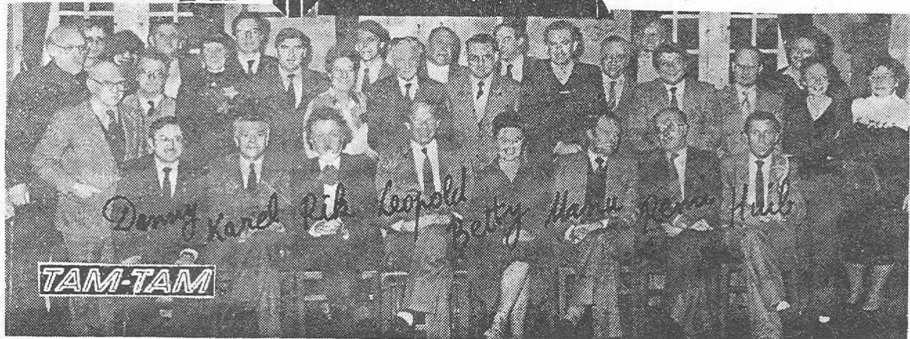
De klassieke «familiefoto» van onze «gemeenteploeg anno '83» werd genomen na de aanstelling.