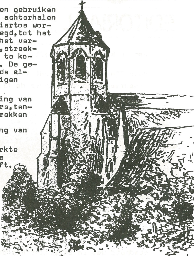
tekening HEINS 1887

200 fr. voor een lidmaatschapskaart. Ere-leden: bijdrage vrij. Lidmaatschapskaarten te bekomen in 't lokaal of bij de bestuursleden, of door storting op een van de vermelde rekeningnummers.