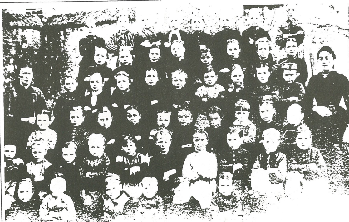
De Knokse meisjes van 1885.